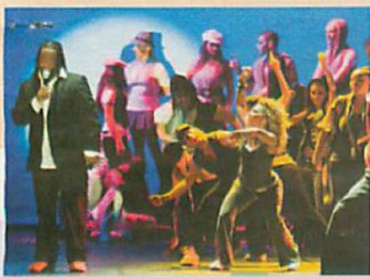
Una scena di "Stand up!"